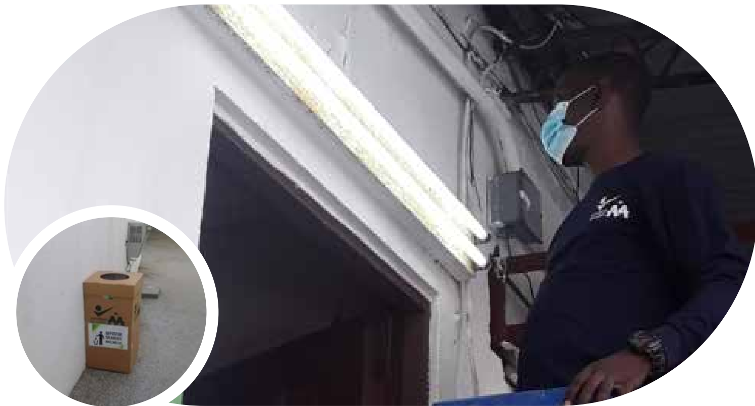
Trabajo de adecuación en la Zona A Pacífico