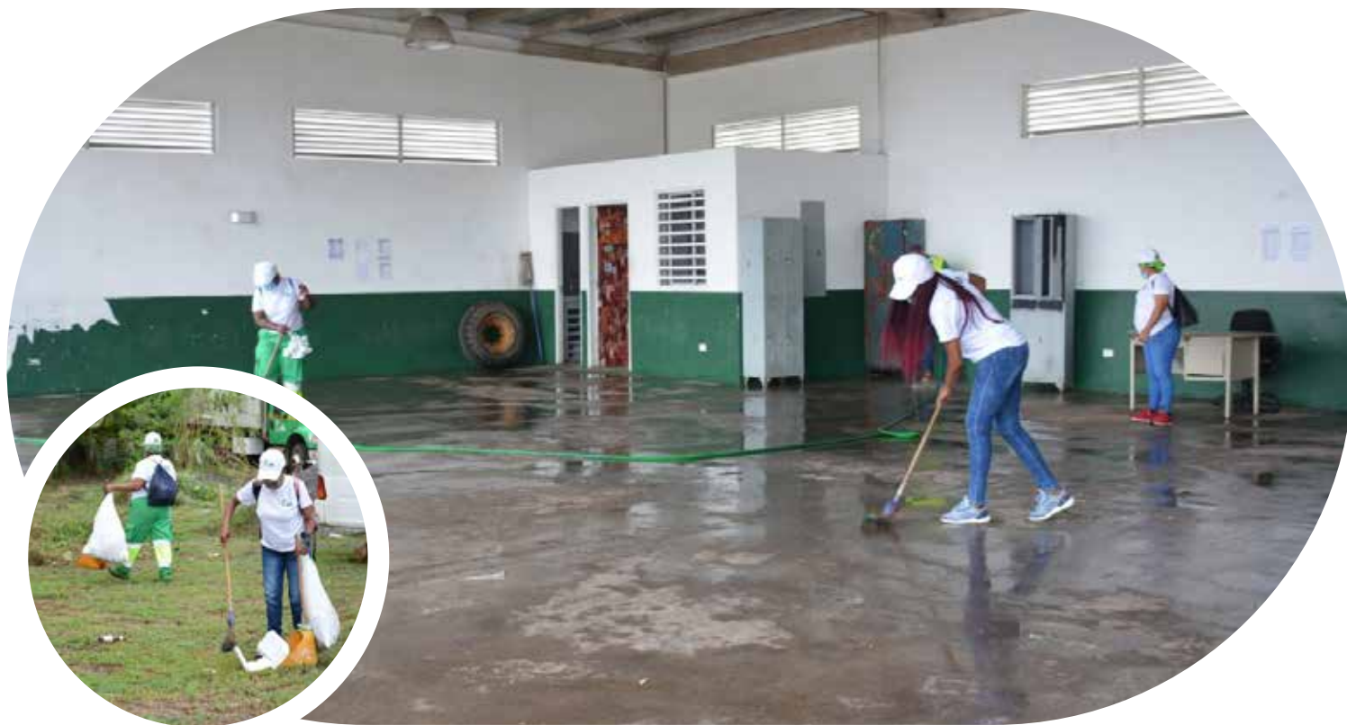
Jornada de limpieza en la Zona A Pacífico