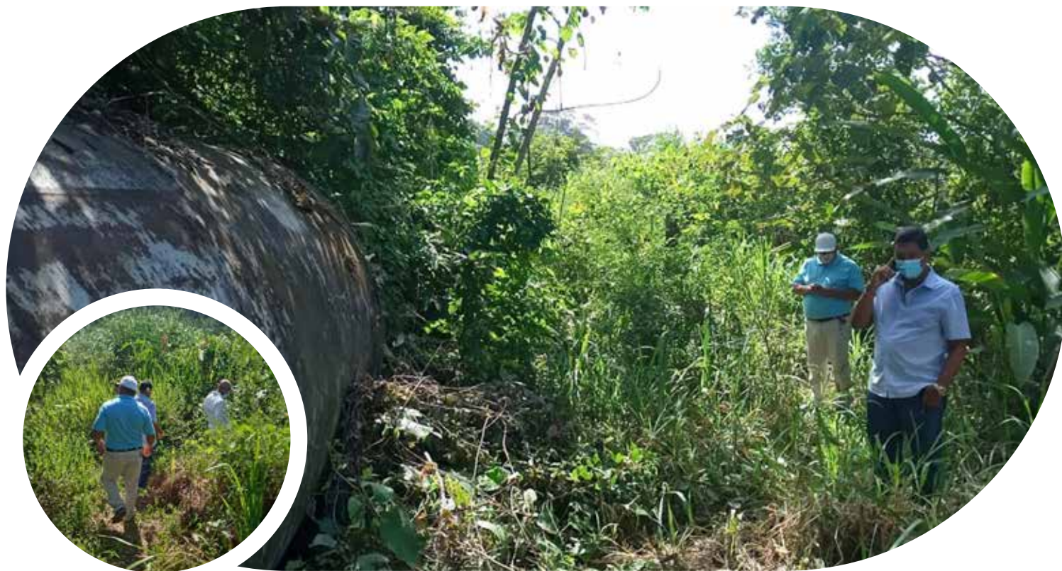
Inspección para llevar agua a las instalaciones de la Zona D Patacón