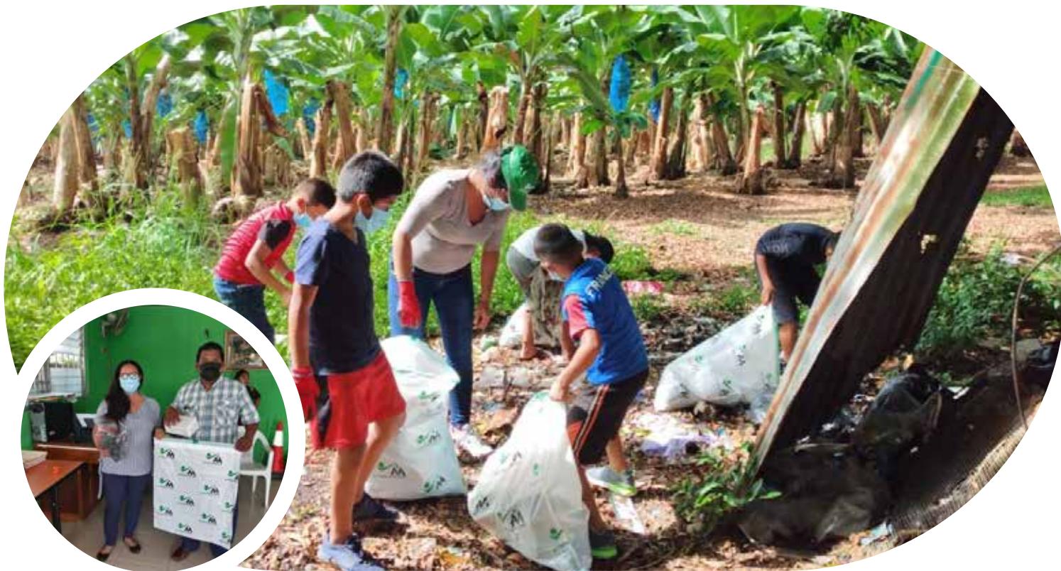
Jornada de limpieza junto a los niños y las damas de la comunidad en la finca 03 en Bocas del Toro