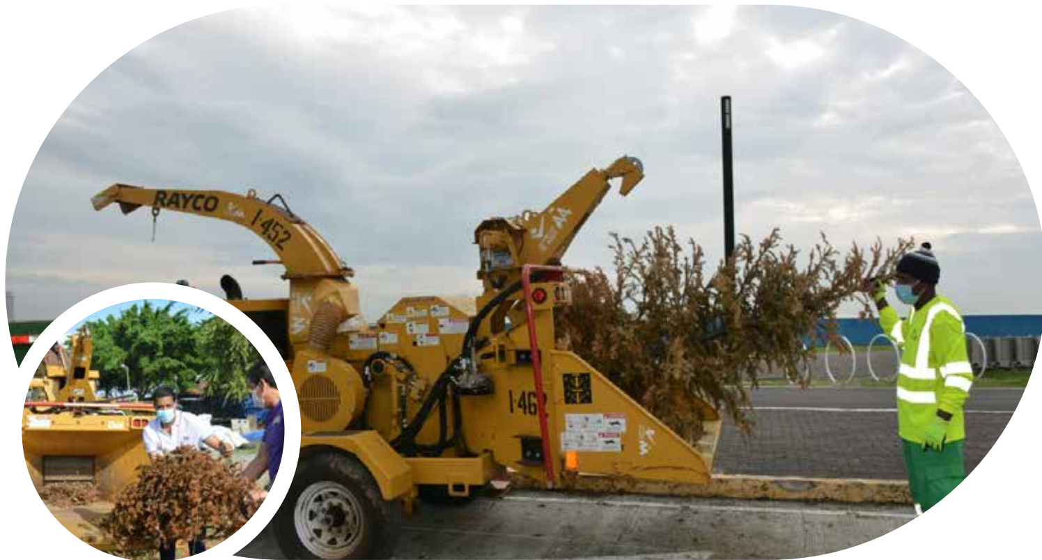
Recolección de arbolitos de navidad en la Cinta Costera