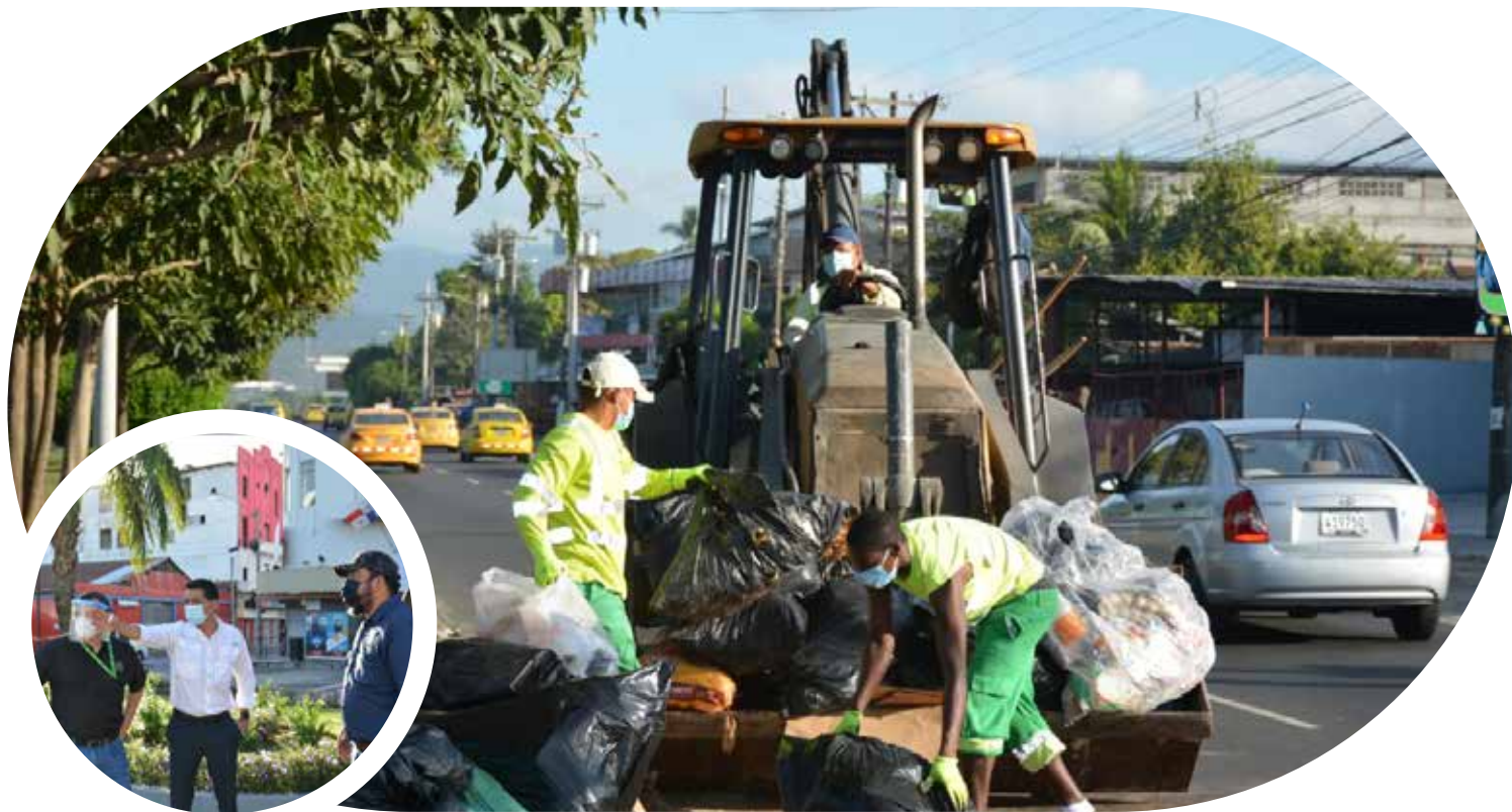
Jornada de limpieza en Tocumen