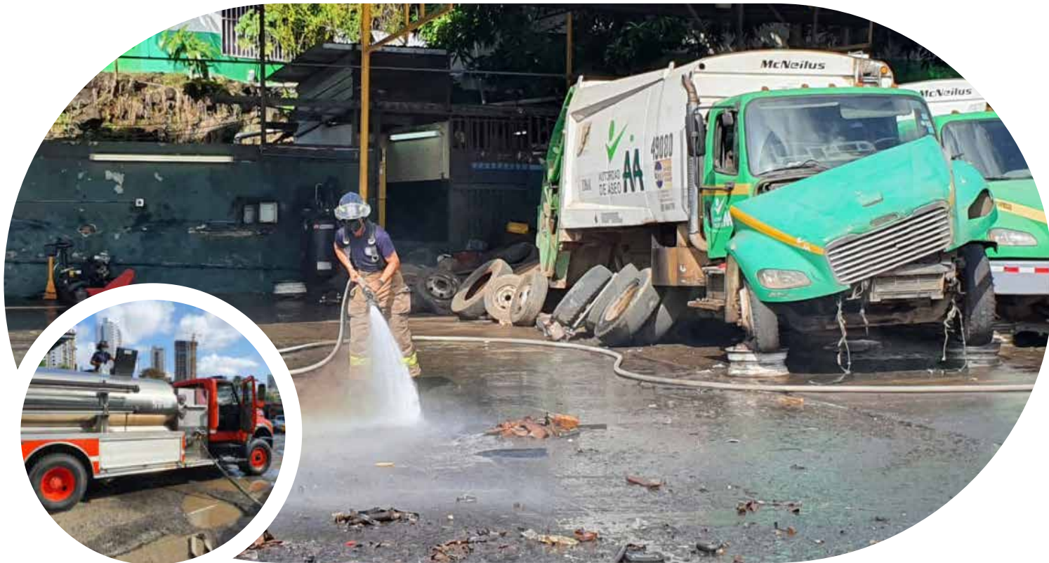
Benemérito Cuerpo de Bomberos de Panamá realiza limpieza profunda y desinfección en Sede Carrasquilla