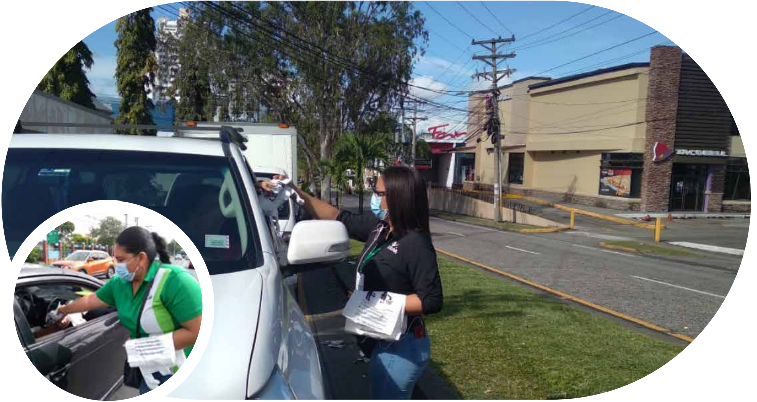
Volanteo de bolsitas biodegradables para autos